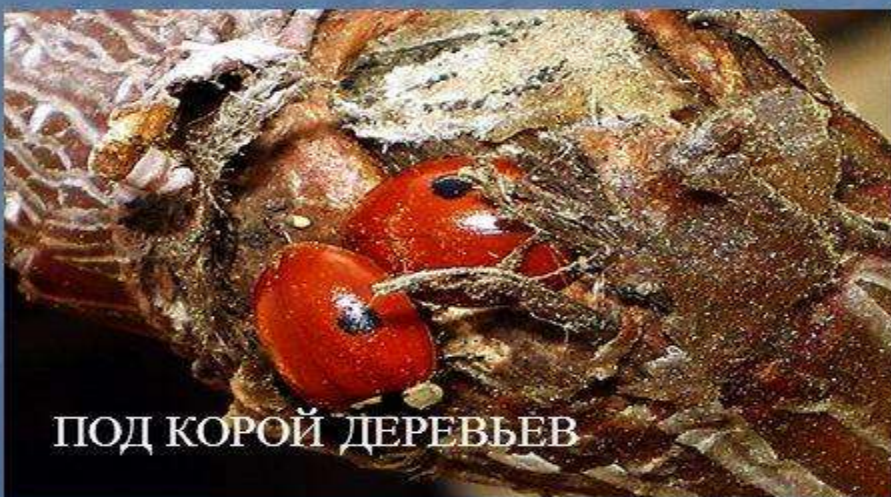
ПОД КОРОЙ ДЕРЕВЬЕВ