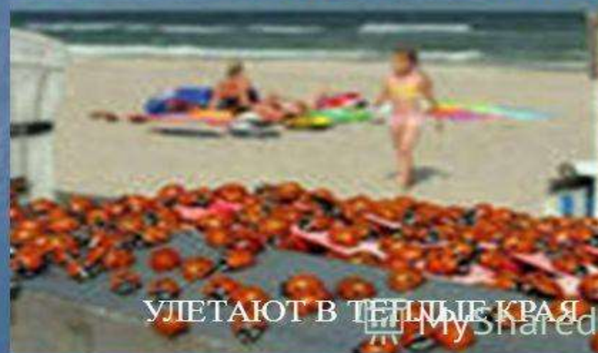
УЛЕТАЮТ В ТЕПЛЫЕ КРАЯ