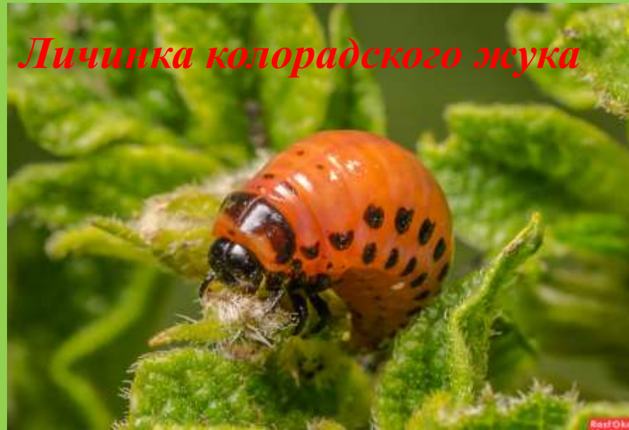
Личинка колорадского жука