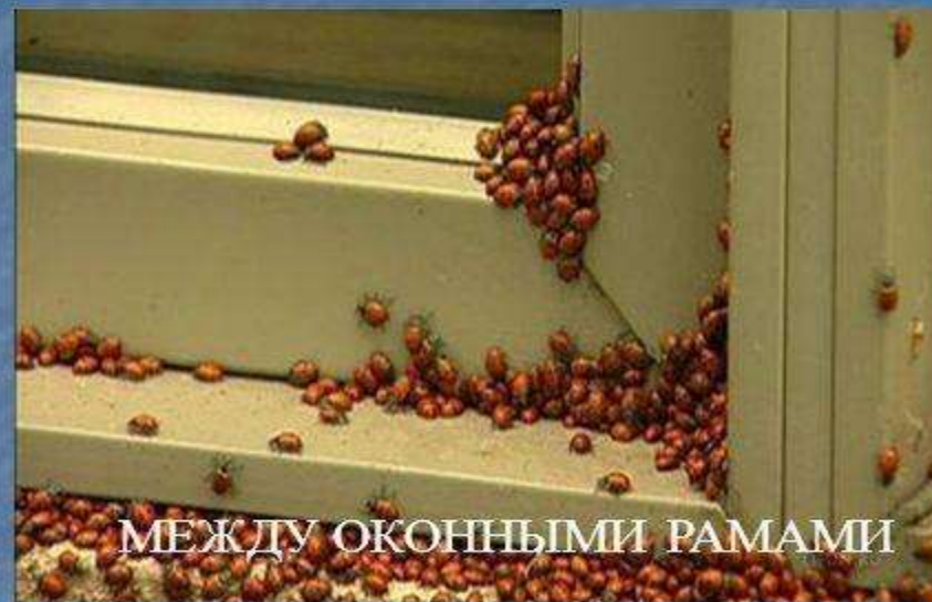
МЕЖДУ ОКОННЫМИ РАМАМИ