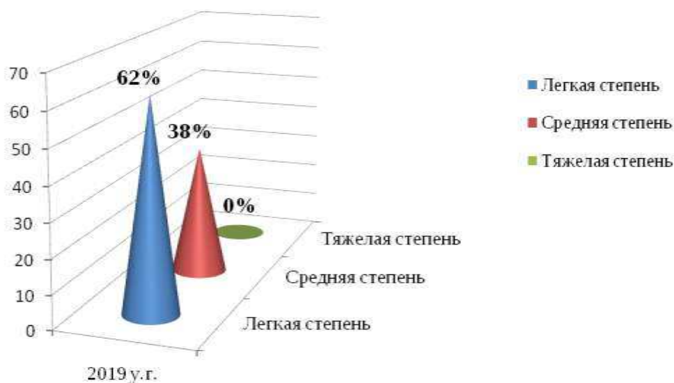
Гистограмма 1. Анализ адаптации детей к условиям ДОУ

В 2019 учебного году проходила адаптация в двух группах раннего возраста. Всего поступило-23 малышей: от году до двух лет-12 , от двух до трех лет-11